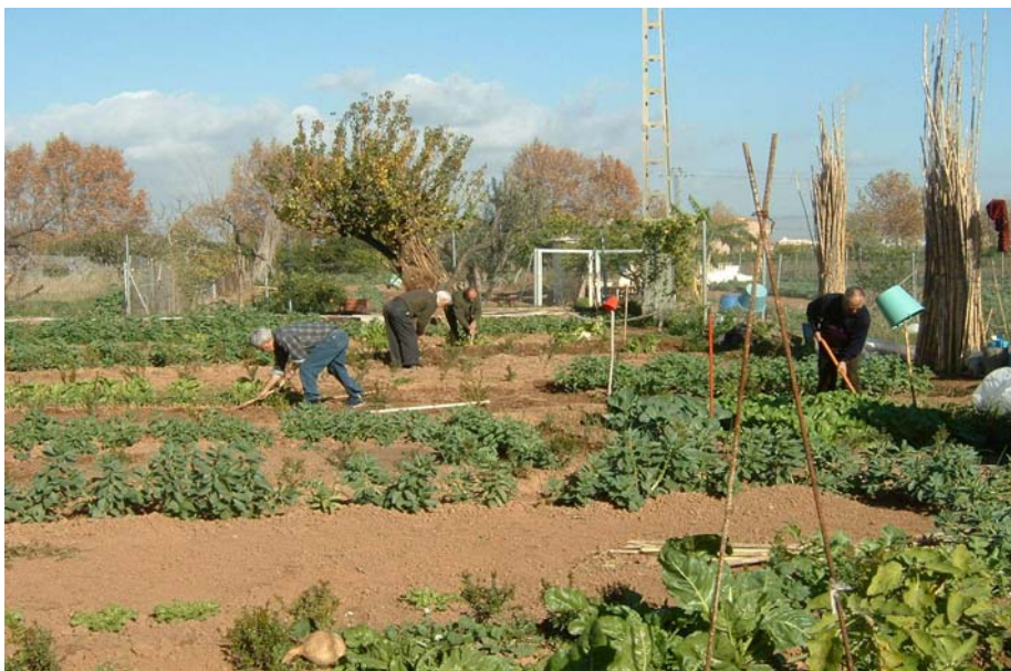
Huertos de ocio de Aldaia.