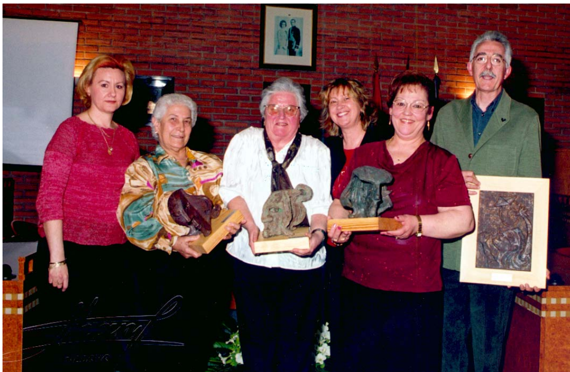
Premios a la Mujer. Se han galardonado mujeres que trabajan con personas discapacitadas.

Muchas son las iniciativas de los dos consejos en el apoyo a la igualdad y la accesibilidad, fruto de su trabajo han sido actuaciones como: recorrido por las calles y plazas en sillas de ruedas y a partir de ahí dar sugerencias de mejoras, propuesta de rutas seguras para llegar a los centros escolares (proyecto en desarrollo), ferias de solidaridad y voluntariado, censura-multa simbólica de atención a las conductas incívicas que afectan a las personas con discapacidad... (ver anexos). El Consejo de Bienestar Social es además el encargado del seguimiento del Plan Aldaia Accesible.