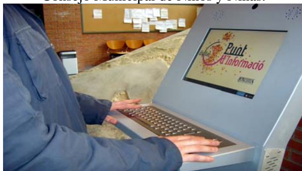
Punto de información telemático accesible.