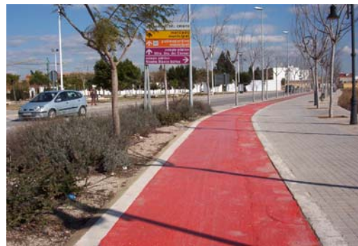
Itinerarios accesibles: Carril-bicipeatonal.