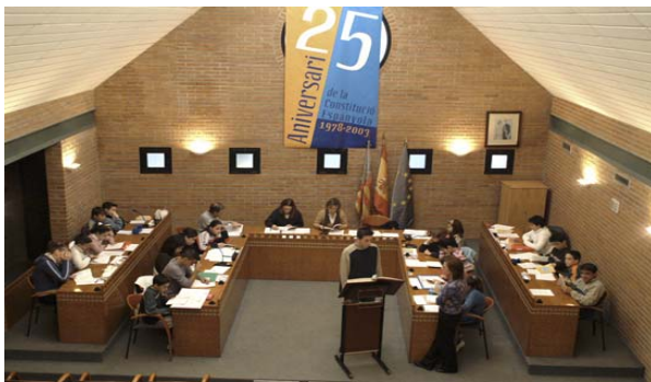
Consejo Municipal de Niños y Niñas.