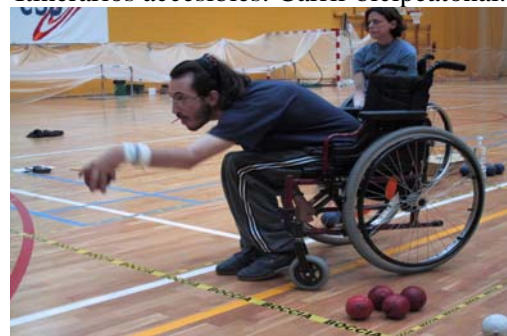
Liga Autònoma de Boccia en Aldaia.