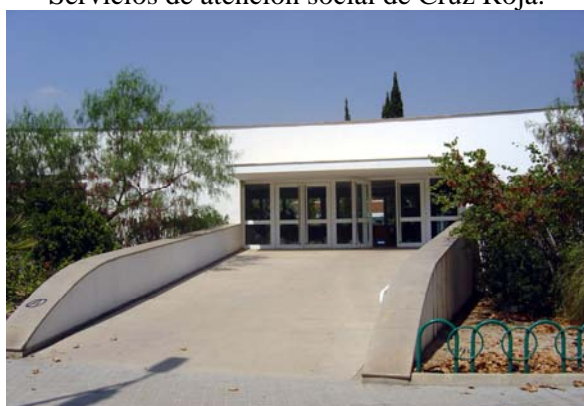
Centro Ocupacional de Personas Discapacitadas Psíquicas