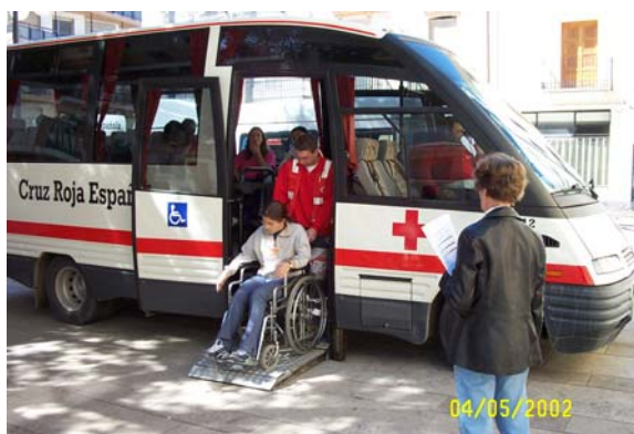
Servicios de atención social de Cruz Roja.