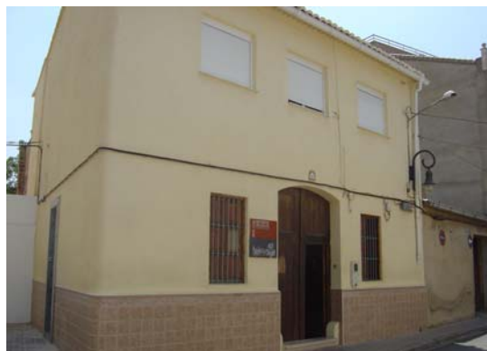
Centro de Día para enfermos mentales.