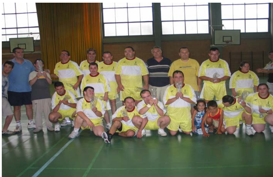
Equipo de baloncesto del Centro Ocupacional de Aldaia.

Este esfuerzo es reflejo de la voluntad de solidaridad de Aldaia. Pero aún es más significativo que sus vecinos y vecinas hayan sabido convivir con normalidad con un 25% de personas que se consideran pueden tener movilidad reducida, sin haber desarrollado fracturas, conflictos o indiferencia. Más aún, Aldaia ha sabido enriquecerse y hoy (desde hace años) es habitual disfrutar del partido semanal de baloncesto entre los chicos y chicas del Centro Ocupacional de Personas Discapacitadas Psíquicas y los chicos/as del IES Carles Salvador. Es también un acontecimiento el partido anual entre el Centro Ocupacional y el Club de Baloncesto de Aldaia. Por otra parte, la Escuela Municipal de Teatro ha integrado un grupo de discapacitados psíquicos, y Aldaia es la sede de la final de la Liga de Boccia de la Comunidad Valenciana, un deporte adaptado que practican personas con parálisis cerebral. Dicho evento lo organiza el Ayuntamiento junto a la Federació d'Esports Adaptats (F·ES·A) de la Comunidad Valenciana.