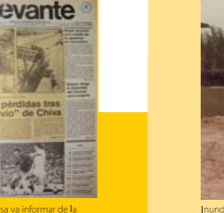
La premsa va informar de la catàstrofe en la conca del barranc de Poio o de Xiva. (Levante-EMV, 11 de novembre de 1989).