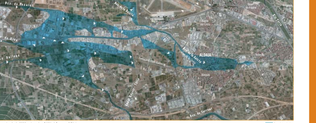
La gran riuada de 2000 va inundar el 60% del terme d'Aldaia. Zones d'inundació de la riuada de 2000 al terme d'Aldaia. Direcció de les aigües.

18 "Octubre és mes d'històries, que deixa males memòries". Aquest refrany es va complir l'any 2000. La "gota freda" va provocar grans riuades els dies 23 i 24 d'octubre. Les pluges torrencials van afectar greument 51 municipis valencians. Aldaia fou un dels pobles que més danys va sofrir, amb el 60% del terme inundat. Les comportes dels carrers del Barranquet i l'avis a la població per megafonia no impediren la catàstrofe. La inundació es va produir pel triple desbordament dels barrancs de Xiva, Gallego i Pozolet a l'altura de l'A-3, i el de la Saleta dins del poble. El Distribuïdor Sud i les obres de la Ronda Est d'Alaquàs van actuar de barrera i arrossegaren més aigua cap a Aldaia. L'aigua desbocada va provocar grans destrosses. Afortunadament, no haguérem de lamentar cap mort.