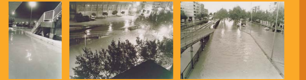
La inundació de la via del tren va incomunicar les dos parts del poble. Zona inundada a l'Institut Carles Salvador. Desbordament de la Saleta pel carrer València.