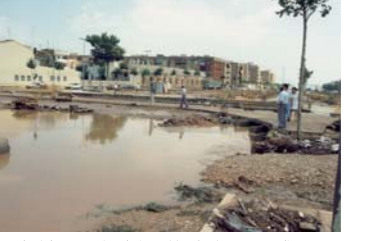
Inundació de 1990. El túnel de l'Estació (en obres) es va anegar d'aigua.

14 En els últims vint-i-cinc anys Aldaia ha sofert tretze inundacions de diferent intensitat. El nivell de destrucció del barranc ha estat marcat pel grau de potència de la pluja. Quan es produeix un ruixat, el Barranquet pot desbordar-se sense provocar grans danys materials. La majoria de vegades el sobresalt acaba amb la inundació dels baixos d'algunes vivendes i dels túnels que comuniquen Aldaia amb Alaquàs. Però quan es dona un episodi de "gota freda", els barrancs de la Saleta, Poio, Pozolet i Gallego, tots quatre, es poden tornar salvatges i en ocasions arriben a inundar el terme municipal.