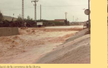
Inundació de la carretera de la Lloma.