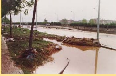
Zona inundada al final del carrer València, al costat de la Casa del Tio Carmelo.