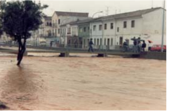
Carrer Hernán Cortés inundat per la riuada de 1989.