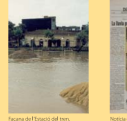
Façana de l'Estació del tren.