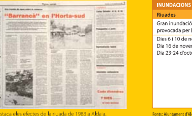
La notícia destaca els efectes de la riuada de 1983 a Aldaia. (7 Dies de la Comarca, 11 de novembre de 1983).

14 En els últims vint-i-cinc anys Aldaia ha sofert tretze inundacions de diferent intensitat. El nivell de destrucció del barranc ha estat marcat pel grau de potència de la pluja. Quan es produeix un ruixat, el Barranquet pot desbordar-se sense provocar grans danys materials. La majoria de vegades el sobresalt acaba amb la inundació dels baixos d'algunes vivendes i dels túnels que comuniquen Aldaia amb Alaquàs. Però quan es dona un episodi de "gota freda", els barrancs de la Saleta, Poio, Pozolet i Gallego, tots quatre, es poden tornar salvatges i en ocasions arriben a inundar el terme municipal.