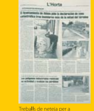
Treballs de neteja per a desenfangar els carrers. (Levante-EMV, 26 d'octubre de 2000).