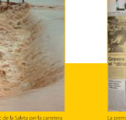
Barranc de la Saleta per la carretera de la Lloma.

16 L'aigua no va agafar la població per sorpresa. L'inici de riuada del diumenge havia posat en avís a l'Ajuntament i Govern Civil, que donà l'alerta als pobles de la ribera del Poio. Abans d'arribar l'aigua al poble havien sigut evacuades 500 persones de la Brillantina, les Barraques, l'Estació i la Colònia, sent traslladades als col·legis Ausiàs March i Mariano Benlliure, on passaren la nit. La riuada deixà el típic caos de brutícia i col·lapse circulatori. Aldaia quedà incomunicada amb l'exterior. El dia 11 la corporació celebrà un ple extraordinari on aprovà per unanimitat sol·licitar al Govern la declaració de zona catastròfica per a Aldaia.