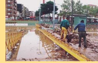
Treballs de neteja en el túnel que comunica el carrer València amb l'avinguda Dos de Maig.