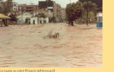
La riuada va cobrir l'Estació del ferrocarril.