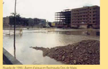
Riuada de 1990. Lluent d'aigua en l'avinguda Dos de Maig.

17 Sis anys després tingué lloc la riuada de 16 de novembre de 1989. La destrucció fou elevada, gran part del municipi quedà cobert per les aigües. Els carrers colindants a la Saleta, el Poliesportiu i la via del tren quedaren totalment ofegats. Els danys foren considerables al carrer Joaquim Blume. Fou una dura jornada de fang. Però el clima no dona treva. Es van repetir tres inundacions mes per ruixats en 1990 i 1991. La distància de temps que separa les riuades de 1989 i 2000 va servir per a fer una profunda reflexió sobre la necessitat de resoldre el problema de les inundacions mitjançant la construcció d'obres hidràuliques de defensa. S'intensifiquen els contactes institucionals entre l'Ajuntament, Generalitat i Confederació Hidrogràfica del Xúquer per a trobar solucions. En 1990 comença a qual·lar la idea del projecte de canalització de la conca del Poio, on figurava el desviament del barranc de la Saleta per fora del nucli urbà.