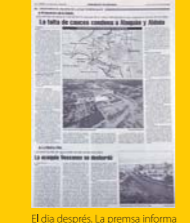
El dia després. La premsa informa dels danys provocats per la riuada. (Levante-EMV, 26 d'octubre de 2000).