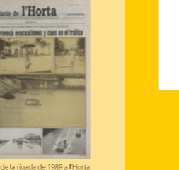
Notícia de la riuada de 1989 a l'Horta Sud. Les tres fotografies assenyalades mostren la devastació de les aigües a Aldaia. (Las Provincias, 6 de setembre de 1989).

16 L'aigua no va agafar la població per sorpresa. L'inici de riuada del diumenge havia posat en avís a l'Ajuntament i Govern Civil, que donà l'alerta als pobles de la ribera del Poio. Abans d'arribar l'aigua al poble havien sigut evacuades 500 persones de la Brillantina, les Barraques, l'Estació i la Colònia, sent traslladades als col·legis Ausiàs March i Mariano Benlliure, on passaren la nit. La riuada deixà el típic caos de brutícia i col·lapse circulatori. Aldaia quedà incomunicada amb l'exterior. El dia 11 la corporació celebrà un ple extraordinari on aprovà per unanimitat sol·licitar al Govern la declaració de zona catastròfica per a Aldaia.