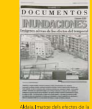
Aldaia. Imatge dels efectes de la riuada en els carrers paral·lels del barranc de la Saleta. (Levante-EMV, 25 d'octubre de 2000).