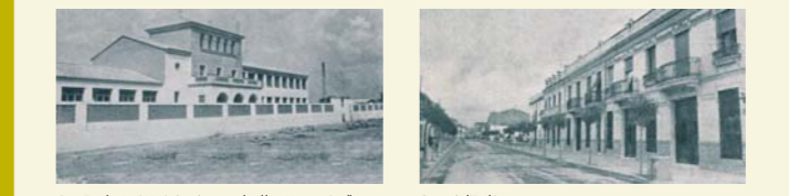
Grup Escolar Josep Maria Sanchis, actual col·legi Mariano Benlliure. Carrer de l'Església.