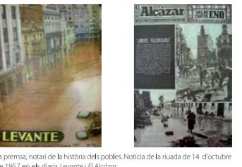
La premsa, notari de la història dels pobles. Notícia de la riuda de 14 d'octubre de 1957 en els diaris Levante i l'Alcazar.