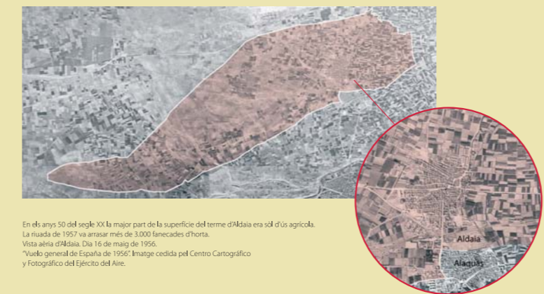
En els anys 50 del segle XX la major part de la superfície del terme d'Aldaia era sòl d'ús agrícola. La riuda de 1957 va arasar més de 3.000 fanecades d'horta. Vista aèria d'Aldaia. Dia 16 de maig de 1956. "Vuelo general de España de 1956".

afectada pels desbordaments dels barrancs de Xiva, Pozalet i Gallego, que envien les seues aigües cap a Aldaia. Tots aquest barrancs formen part d'una conca hidrogràfica més gran, la ribera del barranc del Poio, també anomenat de Xiva o Torrent, que estén els seus tentacles d'aigua per una àrea d'influència de 440 km 2 . La conca del Poio drena en el Parc Natural de l'Albufera.