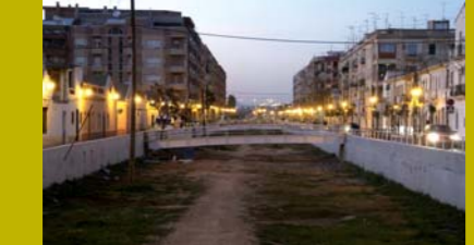
Un barranc mediterrani. Consta el seu llit sec la major part del temps amb les devastadores creixudes cícliques de la tardor.