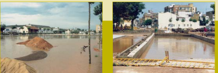
Aldaia. Barrancada de 1990.

La riuada del 14 d'octubre de 1957 va deixar a Aldaia un trist record d'aigua, fang i destrucció. El desbordament del barranc de la Saleta o Barranquet deixà un paisatge de desolació: 3.000 fanecades d'horta arrasades amb les collites fetes malbé, 303 famílies damnificades amb danys considerables en les seues cases i 156 vivendes greument danys, algunes de les quals foren enfonsades per la violència de les aigües. La inundació devastà també indústries, comerços i vies de comunicació, tot paralitzant la vida econòmica del poble.