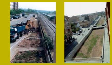
El barranc de la Saleta al seu pas pel nucli urbà d'Aldaia.