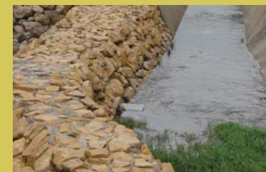
Cuneta del Distribuidor Comarcal Sud, assut de captació d'aigües del barranc de la Saleta per a desviar part del seu cabal cap al barranc de Torrent.