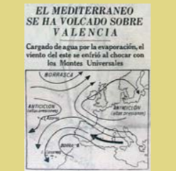
Mapa meteorològic de la riuda de 1957, publicat pel diari Yo de Madrid.

pluges torrencials descarregen milions de litres d'aigua sobre les serres de l'interior, tot provocant grans avingudes de barrancs que deriven cap a la planura al·luvial de l'Horta en forma de riudes catastròfiques.