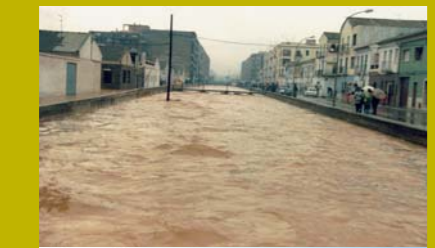
Un barranc mediterrani. Consta el seu llit sec la major part del temps amb les devastadores creixudes cícliques de la tardor.