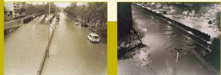
Aldaia. Gran inundació del 23 i 24 d'octubre de 2000.