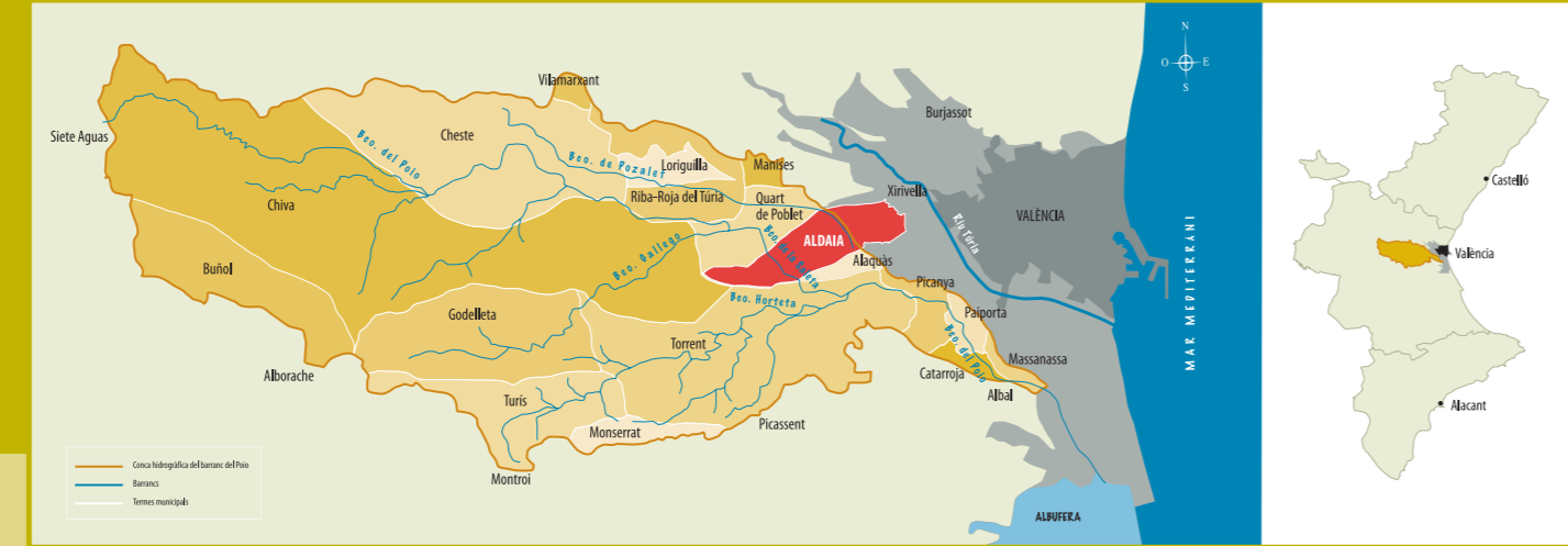
Conca hidrogràfica de la rambla del Poio, de la qual forma part el barranc de la Saleta d'Aldaia.