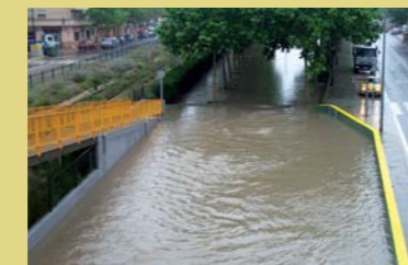
Barranc de la Saleta pel carrer València.