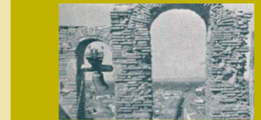
L'Arxiu Parroquial de la Mare de Déu de l'Anunciació conserva nombroses notícies sobre les riudes que ha patit Aldaia al llarg de la història. Quinquèmbri, Tomo IX, Full 323, Any 1776.